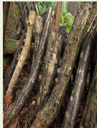
写真:「シイタケの森」の様子