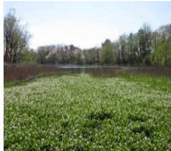
(西水上回廊) で見られます！