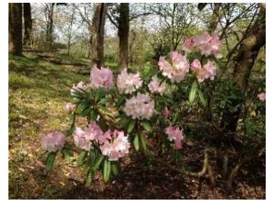
(古墳エリア) で見られます！