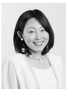
ソプラノ：松崎 ささら

文化庁芸術祭大賞、音楽之友社賞、毎日芸術賞、京都音楽賞、レコード・アカデミー賞、サントリー音楽賞、中島健蔵音楽賞などを受賞。