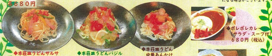
◆本荘血うどんサルサ