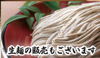
生麺の販売もごさいます