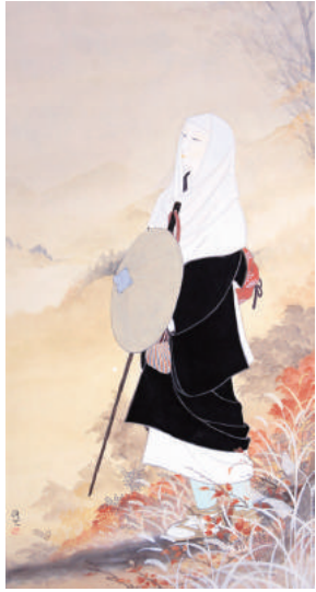
「晩秋の露」 羽鳥絹世 変型50号(116×62)

作者プロフィール 1950年 新潟県旧松代町芋島生まれ。幼少期より志村立美や岩田専太郎等の美人画(挿絵)に興味を持ち独学で研鑽。抒情挿絵の研鑽の一方、日本画の技法を学び独自の世界観を見出す。近年では2021年第34回パリ国際サロンにて「ユニバーサル・デザール」賞を受賞。海外でも高い評価を受けている。